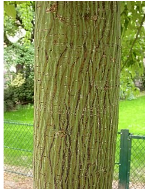
Acer davidii subsp. davidii