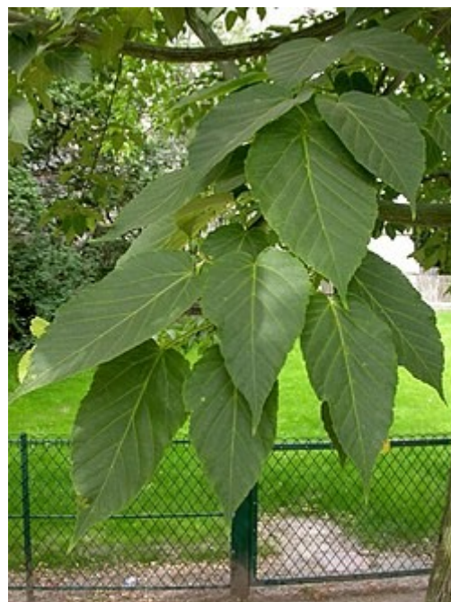
A. davidii subsp. davidii