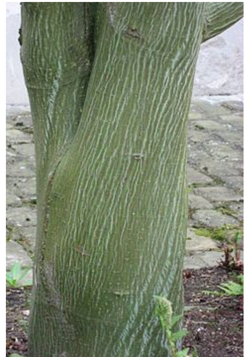
Corteza del cultivar 'Ernest Wilson'